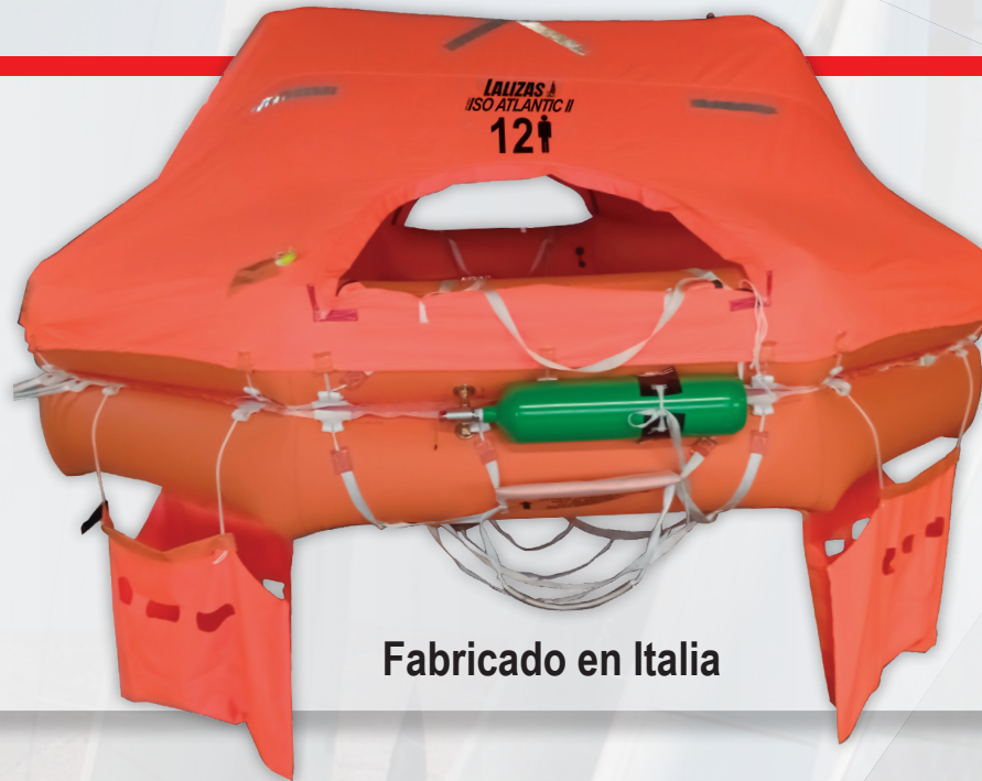
Fabricado en Italia